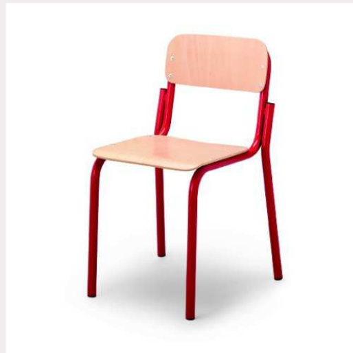
Immagine di : Sedie per aule scolastiche Articolo : PACI-33120.25.5

Documentazione Documenti di : Sedie per aule scolastiche Articolo : PACI-33120.25.5