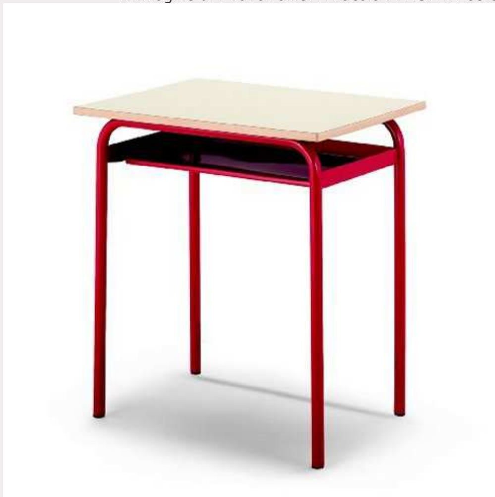
Immagine di : Tavoli allievi Articolo : PACI-22105.5