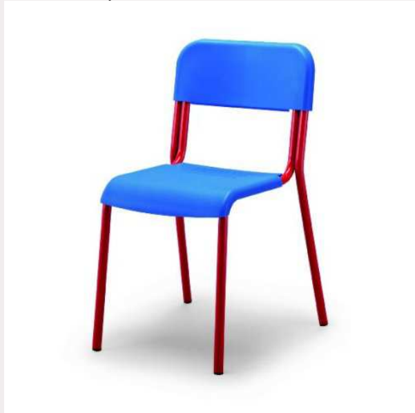
Immagine di : Sedie per aule scolastiche Articolo : 33190.25.6