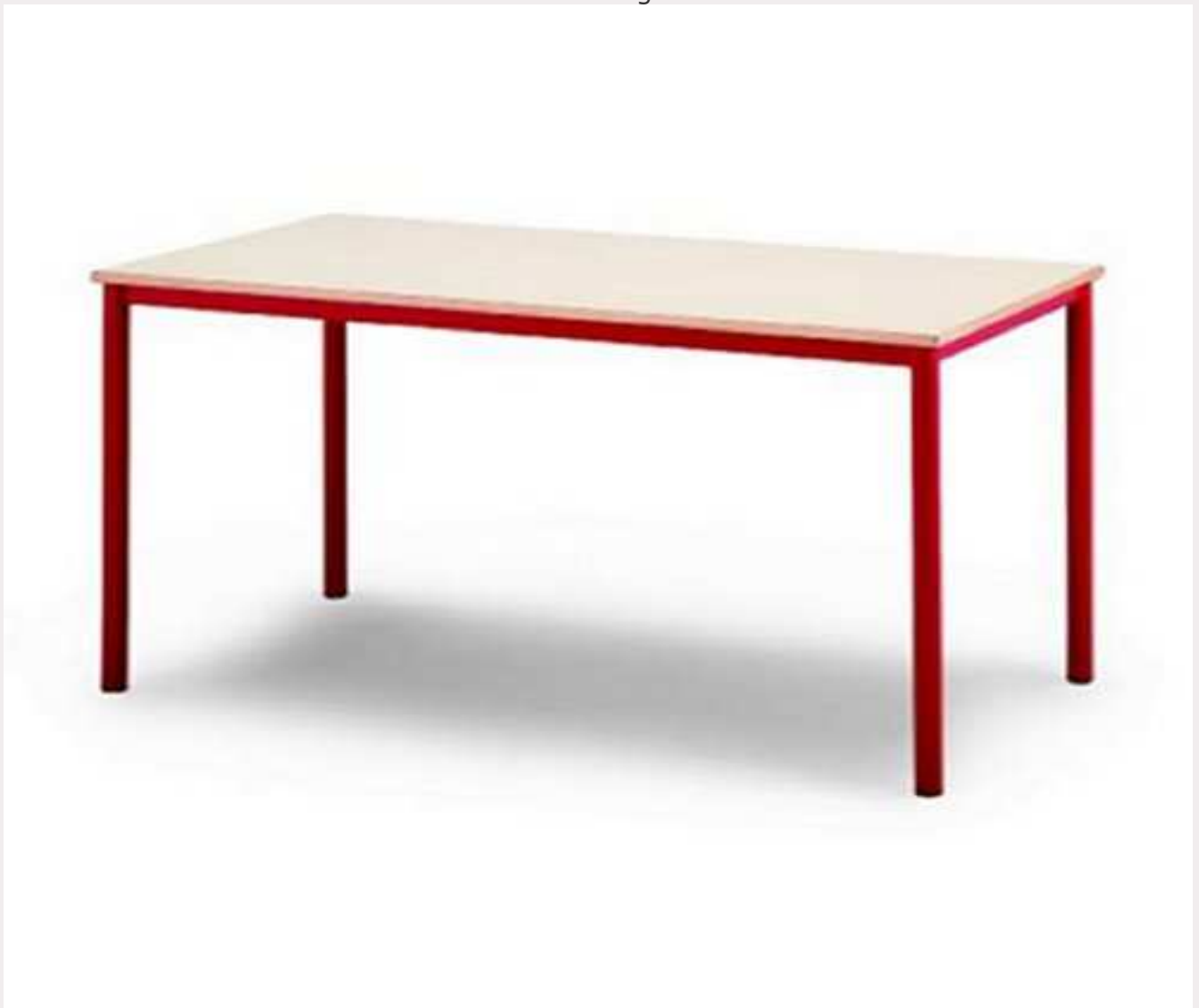
Immagine di : Tavoli mensa Articolo : 22800.76